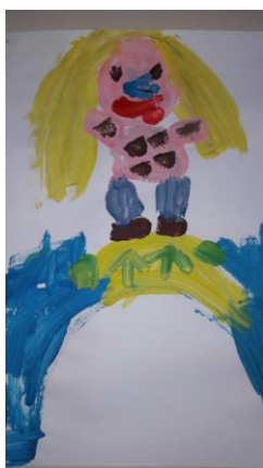
Liene op de trampoline