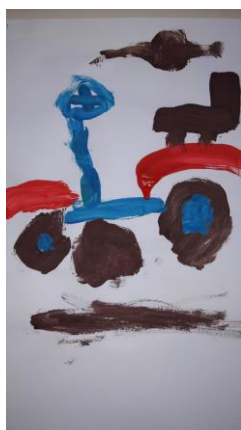
Milan op de skelter