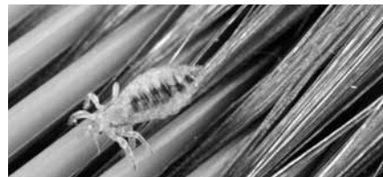
Hoofdluis op een kam.